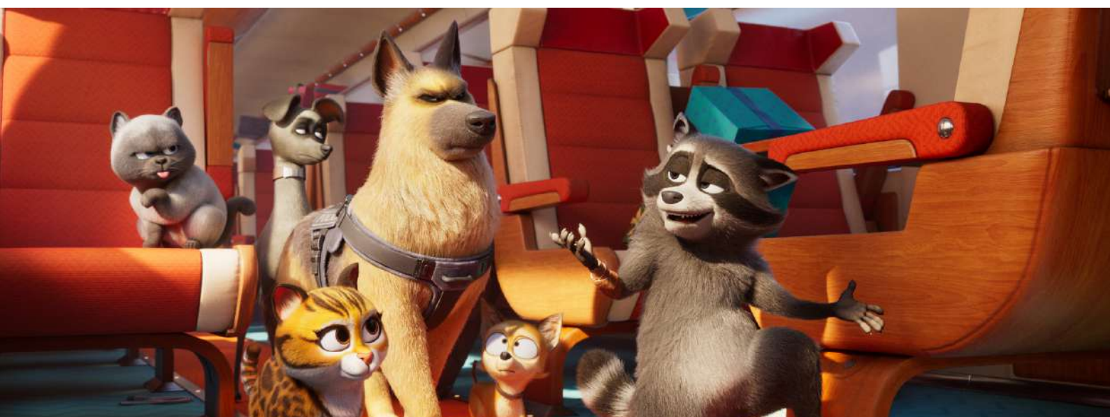
Falcon Express, au cinéma en 2025